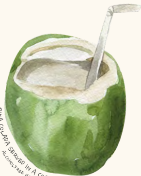
PINA COLADA SERVED IN A COCONUT 284KR ALCOHOL-FREE 184KR